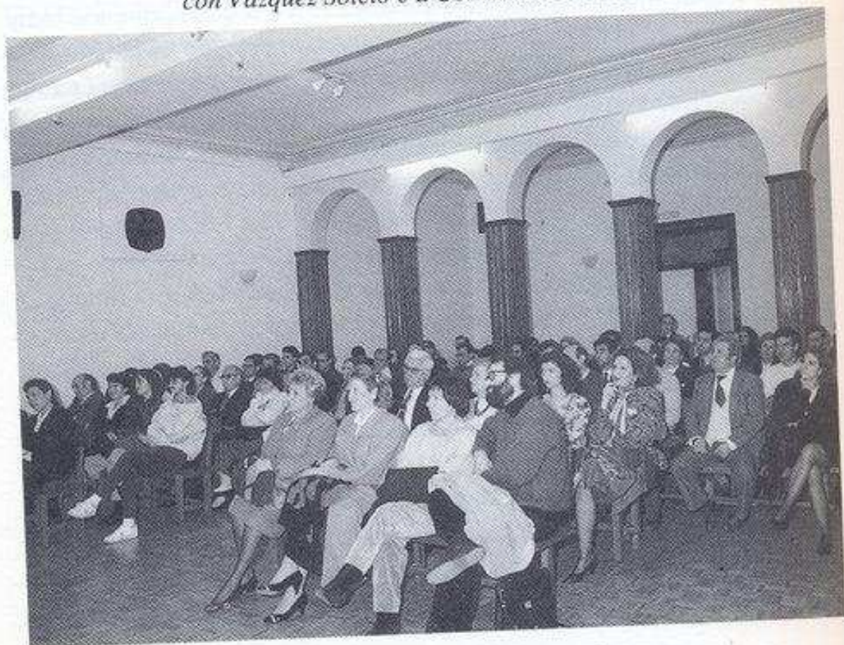
Acto no Centro Galego de Barcelona