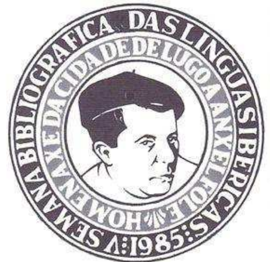
Medalla da V Semana Bibliográfica da Linguas Ibéricas. Homenaxe da cidade de Lugo a Ánxel Fole

Concello de Lugo . AF foi nomeado polo Concello de Lugo Fillo Predilecto da Cidade en xaneiro de 1985, e unha rúa leva o seu nome ( vid Ánxel Fole , rúa). Tamén promove unha edición de Terra brava (3ª edición. Cincocentos exemplares numerados. Galaxia/Concello de Lugo . 1985), e co gallo do seu pasamento, edita o libro Os escritores lucenses arredor de Fole . Nas festas do San Froilán de 1985, entre os días 7 ó 13 de outubro, AF foi centro dunha serie de actos de homenaxe con motivo do seu nomeamento como Fillo Predilecto. Houbo unha mesa redonda coa participación dos autores dos tres libros sobre o escritor ( Rodríguez Fer ("A súa fortuna cinematográfica foi escasa, cando se tentou de adaptar a isa linguaxe algúns dos