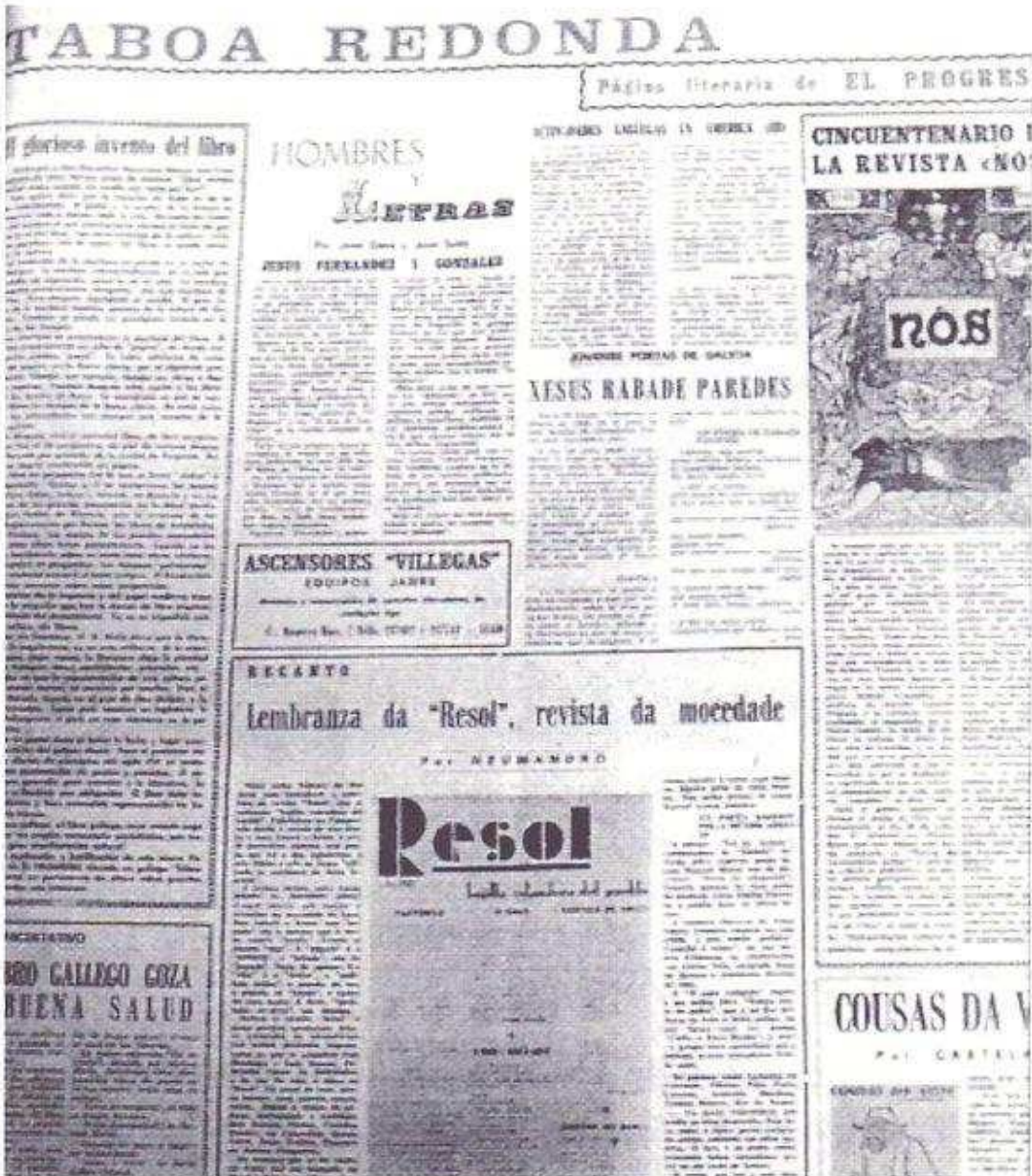
A primeira Táboa