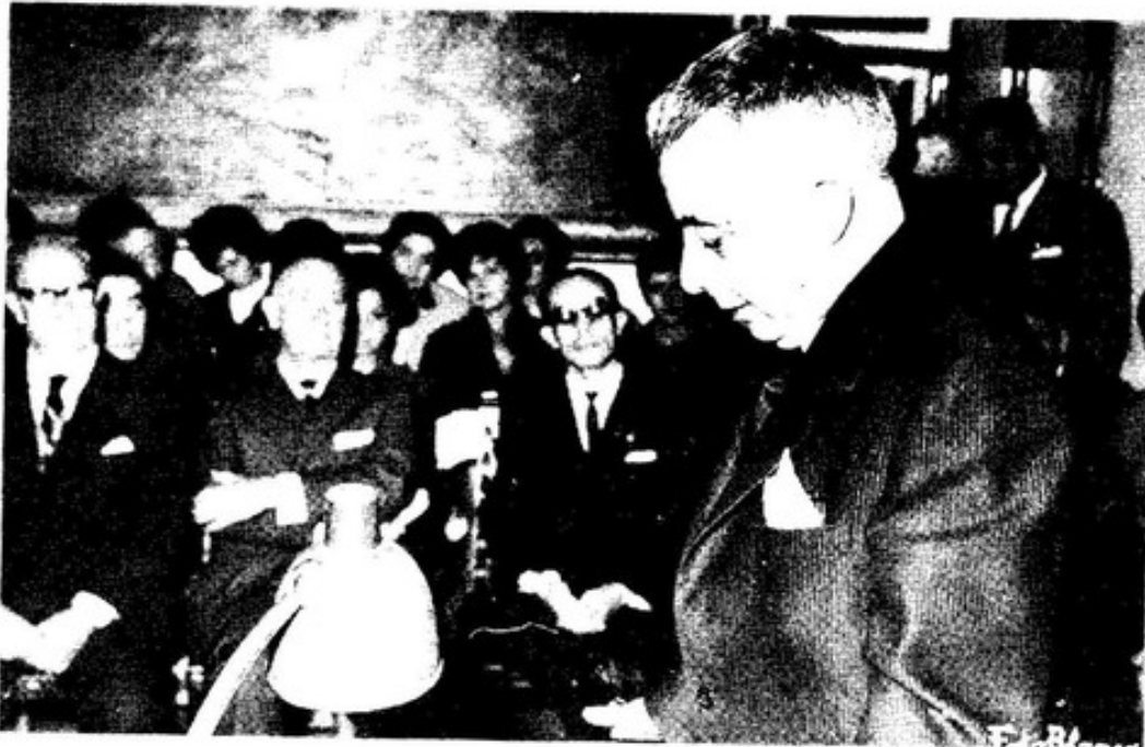
Fole le o seu discurso de ingreso como novo académico RAG

Raúl. Personaxe do conto ¿Egua ou cabalo? , incluído no libro CDN. Pertence á "peña do Metropol ". Despois de descubrir o segredo do cadro reflexiona sobre un novo tema: "Se unha táboa pintada en dobre deu tanto que cavilar e disputar, ¿que non dará unha concencia dobre?"