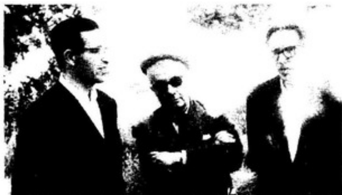
O escritor, entre Piñeiro e Aníbal Otero

Plaza Mayor . Sección de AF na Hoja del Lunes , de Lugo, que