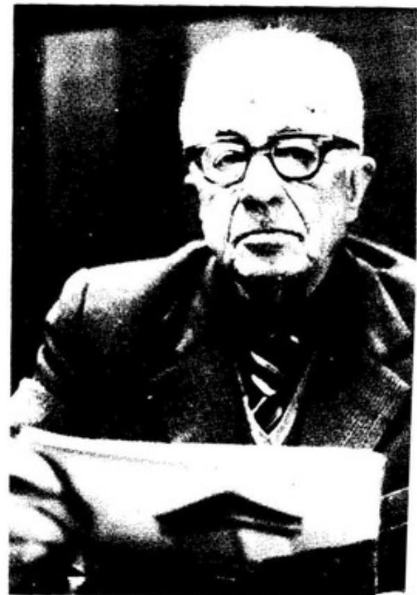
Fole mantivo sempre o seu compromiso ético/estético coa vida