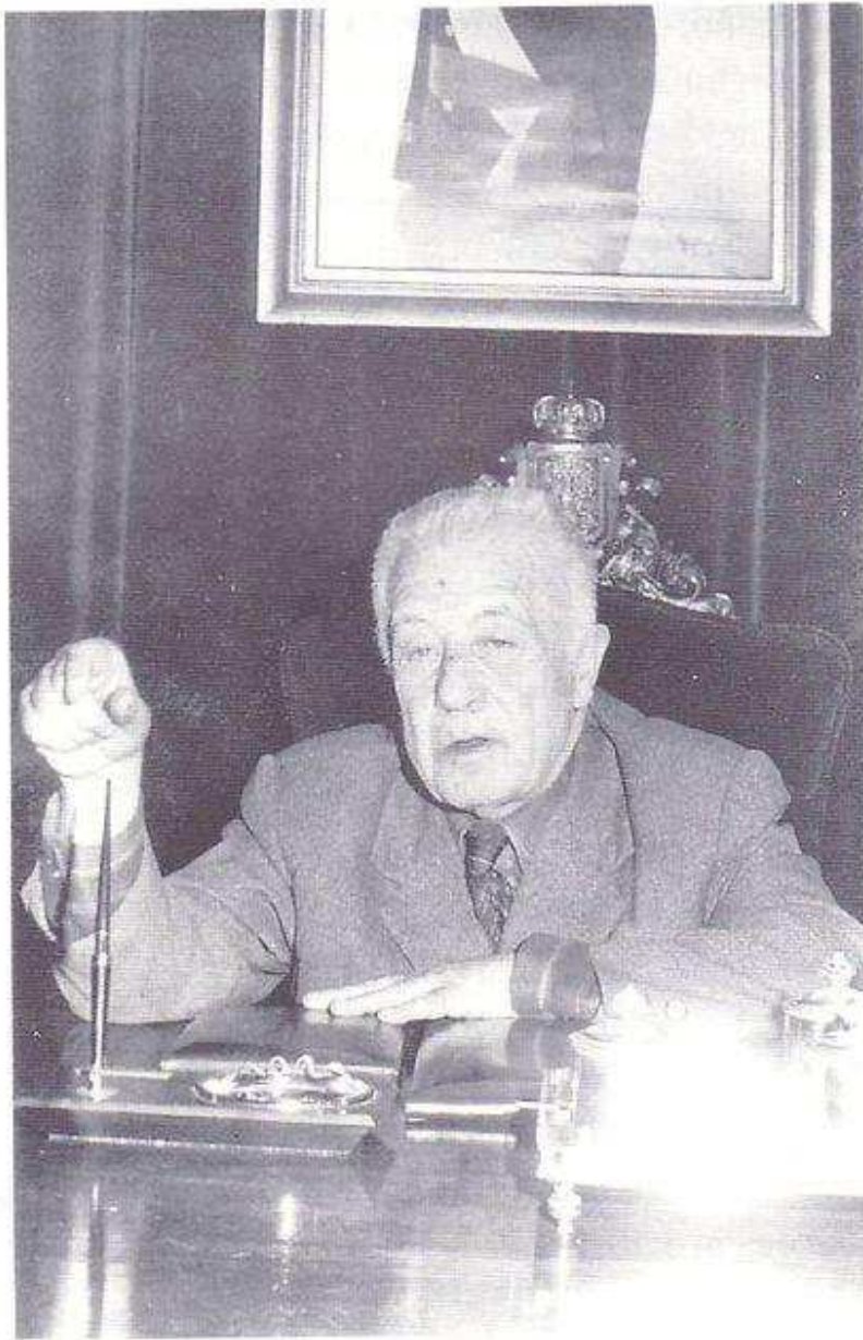
O Fillo Predilecto da Cidade fala dende a cadeira do alcalde