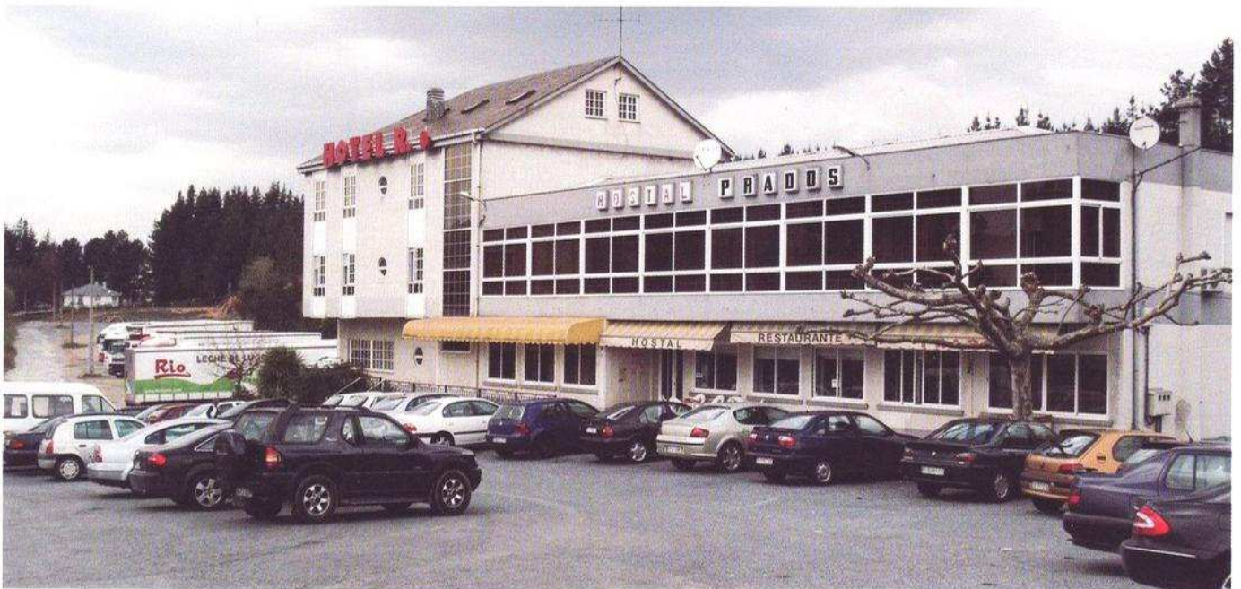
Restaurante Prados en Veiga de Anzuelos.

Os actuais donos do pazo son conscientes do seu enorme interese artístico e monumental. É normal que se sintan orgullosos da súa propiedade. Teño oído a moitas persoas laiarse porque nos patios destes pazos atópanse carros, moreas de leña, apeiros labregos, galiñas peteirando miñocas... Eu penso que é fermoso dar con familias labregas en mansións nobres. Estamos tan afeitos a ver que habitan casas ruíns -moreas de pedras e laxes- que nos estrañamos en vendo algúns pazos señoriais en mans de paisanos, cando a cantería dos nosos artesáns cadra tan ben coa paisaxee coa nobreza da nosa xente.../...Oxalá que os labregos poidan vivir todos en pazos”.