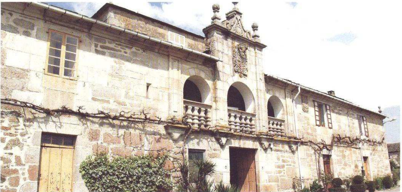
Pazo do Corgo.

En 1953 construíuse unha reprodución deste edificio na Casa de Campo de Madrid para represen-