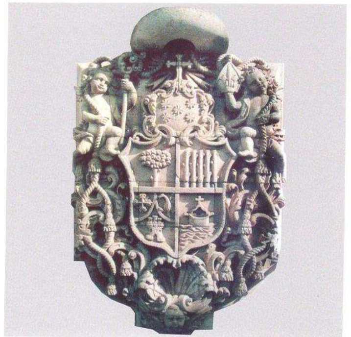
Escudo de Rismol y Quiroga