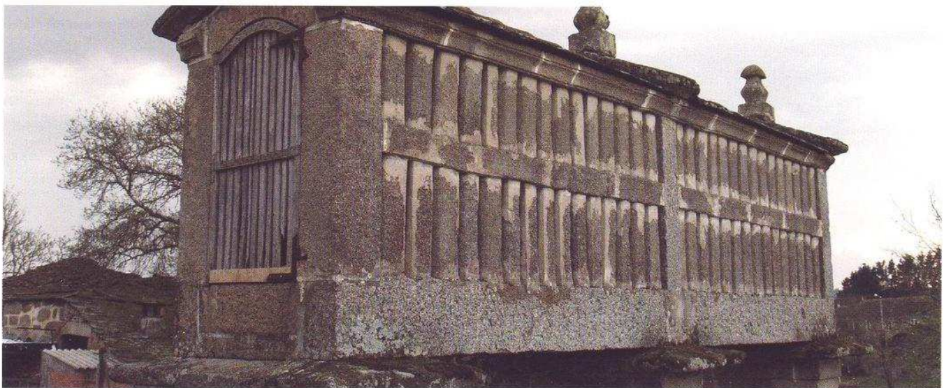
Hórreo en Cereceda