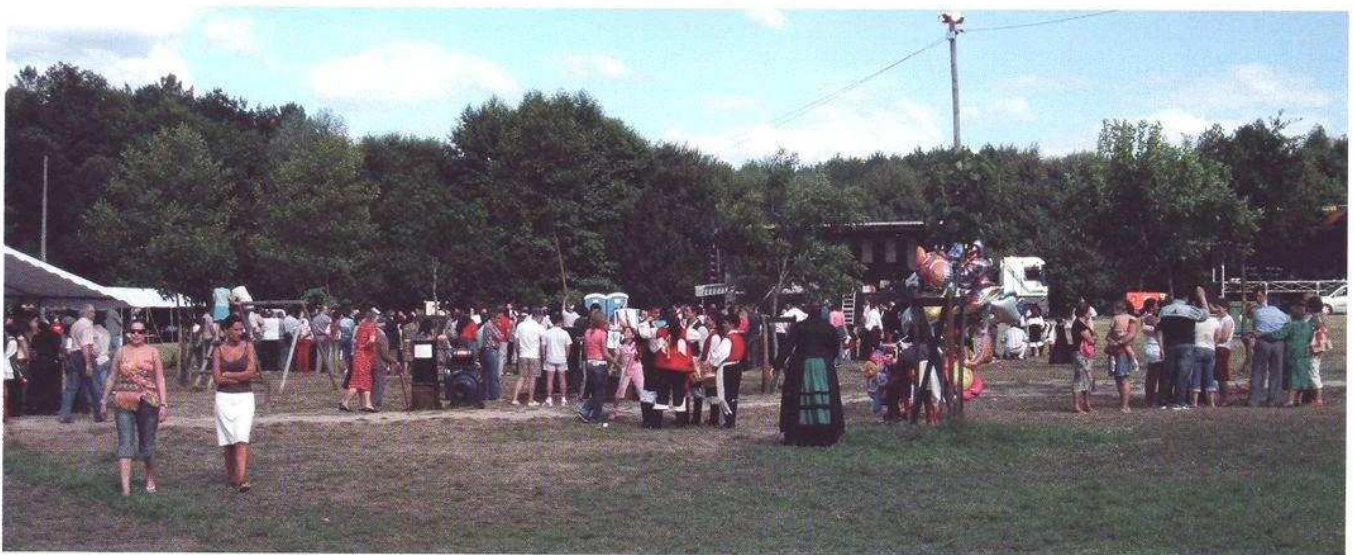
Festa do río